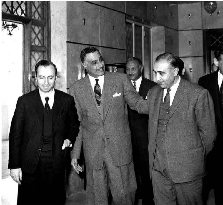
عبد الناصر يستقبل بمنزله فى منشية البكرى القادة السوريين والعراقيين فى إطار محادثات الوحدة الثلاثية